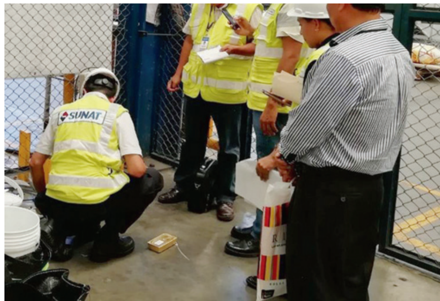
Les agents de l'administration fiscale péruvienne ont procédé à la fin du mois de mars à une saisie d'or d'origine douteuse. OSCAR CASTILLA